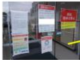
病院玄関の扉設置 ・発熱者は予の電話での検診を依頼 ・入院患者への検診の制限 ・マスク着用のお願ひ