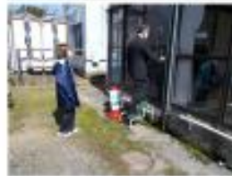
発熱者が院内で待機する部屋に誘導