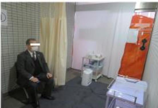
専用待合室内（2名分）と 診察ブース（奥のテント）