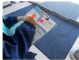
外来患者の受付時の対応 ・発熱者は自家用車での待機を要請 ・自家用車以外の患者は 正堂玄関以外の仮入り口に誘導する