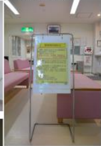
正面玄関自動ドアより 受付前掲示物