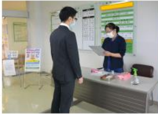
看護師によるトリアージ