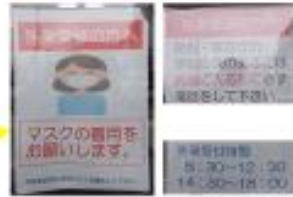
玄関の表示 ・マスク着用のお願ひ ・発熱の電話による検診のお願ひ