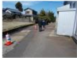
外来患者が発熱、呼吸器症状がある場合 ・通常の出入り口とは別の入り口に誘導