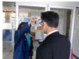
外来患者の受付時の対応 ・非接触性体温計での検温 ・手すりなどのアルコール消毒依頼 ・マスク着用のお願ひおよび検温