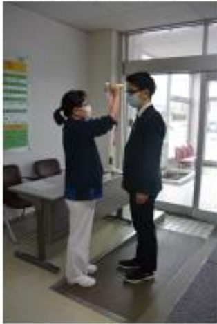
正面玄関にて 来院者の検温実施