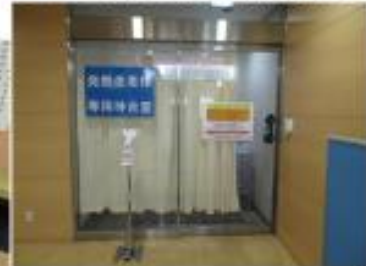
37.5℃以上の方の専用待合室