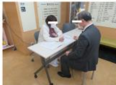
看護師によるトリアージ (発熱者、風邪症状のある方)