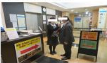
来院者全員に検温実施