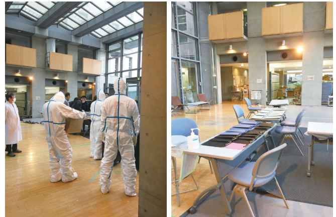
写真1 現場の状況(問診エリア)

私たち医療班は、下船者のファーストコンタクトを担うことになった。昼過ぎの第一陣受け入れまでの間に、医療班の手順作りや入居者の行動シミュレーションを手早く実施し、準備を整えた(写真1)。下船者は大型バスで到着した。全員マスクを着用していたが、クルーズ船内で着用したものであったため、入口での手指消毒時に新しいマスクを着用してもらった。各人の荷物は、スーツケースなど大きなものは自衛隊が消毒して部屋まで運び入れた。玄関で医師による問診を行ったが、予想通り高齢者が多