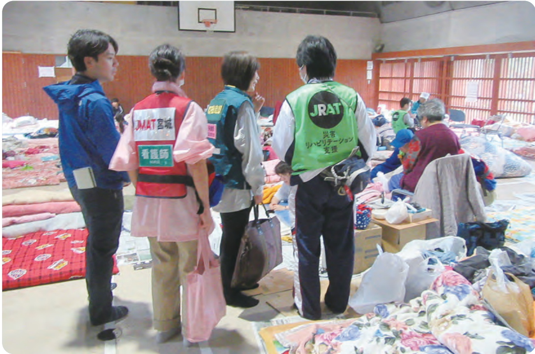
避難所を訪問し、状況を伺いリハビリテーショントリアージを行うところ