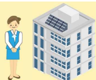
後期高齢者医療広域連合