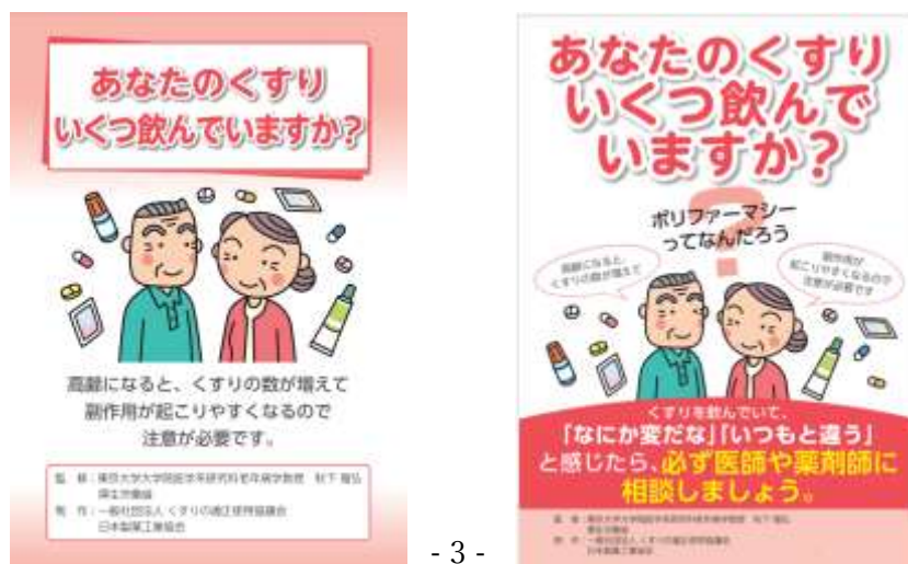
図1 一般社団法人くすりの適正使用協議会ウェブサイト「あなたのくすりいくつ飲んでいきますか」のパンフレット(図左)、ポスター(図右)のイメージ

https://www.rad-ar.or.jp/knowledge/post?slug=polypharmacy