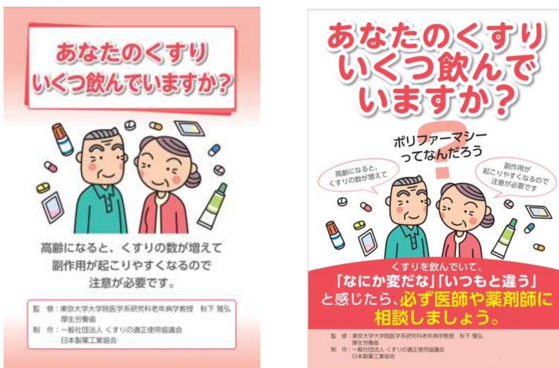
図1 一般社団法人くすりの適正使用協議会ウェブサイト「あなたのくすりいくつ飲んでいきますか」のパンフレット(図左)、ポスター(図右)のイメージ

https://www.rad-ar.or.jp/knowledge/post?slug=polypharmacy